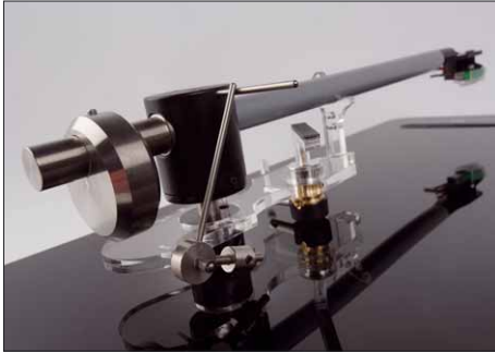
Das Antiskating wird wie bei den „besseren“ japanischen Tonarmen der 70er Jahre über ein Gestänge samt verschiebbarem Gewicht eingestellt