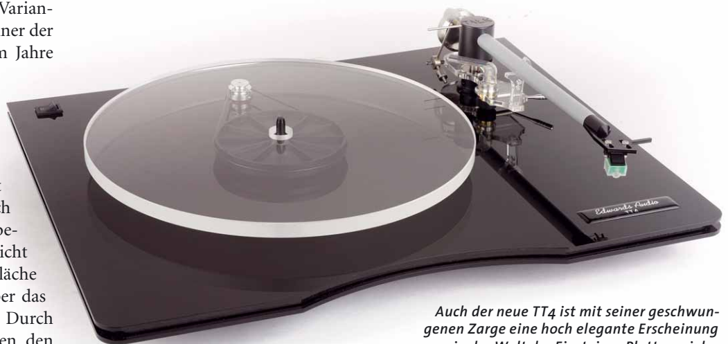
Auch der neue TT4 ist mit seiner geschwungenen Zarge eine hoch elegante Erscheinung in der Welt der Einsteiger-Plattenspieler

Ausgestattet ist der Edwards mit dem System Zephyr 100, das den meisten Vinylhörern unter einem anderen Namen