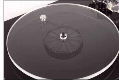
Der transparente Hauptteller erlaubt den freien Blick auf die darunter liegende Antriebseinheit. Er kann ebenso wie der Subteller problemlos ausgetauscht werden

Der TT4 hat – und das ist ebenfalls neu bei Edwards – eine Zarge, die nicht mehr einfach aus MDF besteht, sondern dreilagig aufgebaut ist, um interne Resonanzen zu verhindern. Das sieht durch die leicht nach innen versetzte mittlere Schicht sehr modern und elegant aus. Zusätzlich zu den drei bisher lieferbaren Farben Rot, Weiß und Schwarz, kann der TT4 auch in Grau geordert werden. Geblieben ist der für Edwards Audio charakteristische ausgeschnittene Bogen in der Front der Zarge. Die klappbare Haube der größeren Modelle ist beim in der Basisversion inklusive Tonabnehmer 569 Euro günstigen TT4 dem Rotstift zum Opfer gefallen. Dafür gibt es das so genannte Z-Cover, eine den Konturen des TT4 angepasste Platte, die auf dem Teller aufgelegt wird und diesen samt Tonarm im Ruhezustand schützt. Fürs Musikhören nimmt man die „Haube“ dann ab, womit der TT4 dann frei steht – optisch ohnehin immer die bessere Variante, denn seien wir einmal ehrlich: Einer der Gründe fürs Schallplatte-Hören im Jahre 2021 ist doch die Ästhetik des Abspielvorgangs.