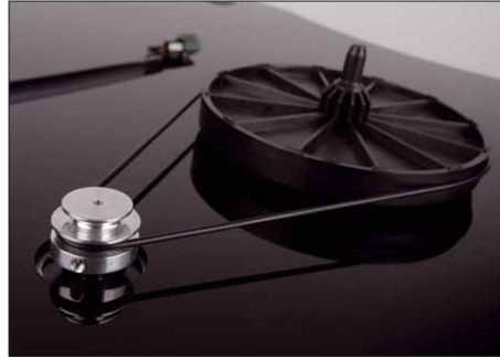
Der in der Zarge in Gummipuffern aufgehängte Motor treibt über den „Big Belter“ den Subteller aus Kunststoff an