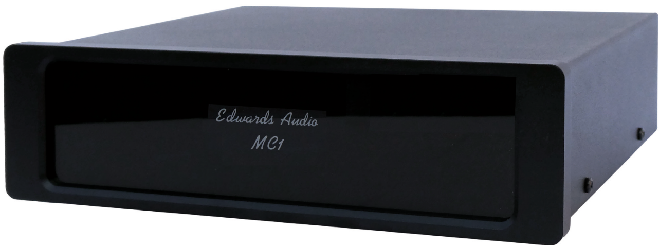
Phonovorverstärker Edwards Audio MC1 Mk2 von Talk Electronics